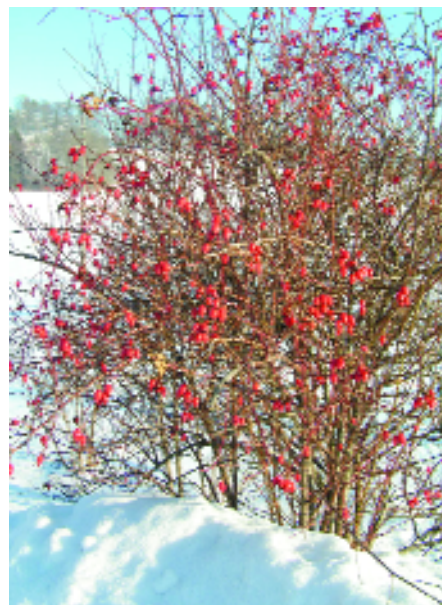
Durch die Bestäubung der Bienen ist auch in der Natur der Tisch reich gedeckt.