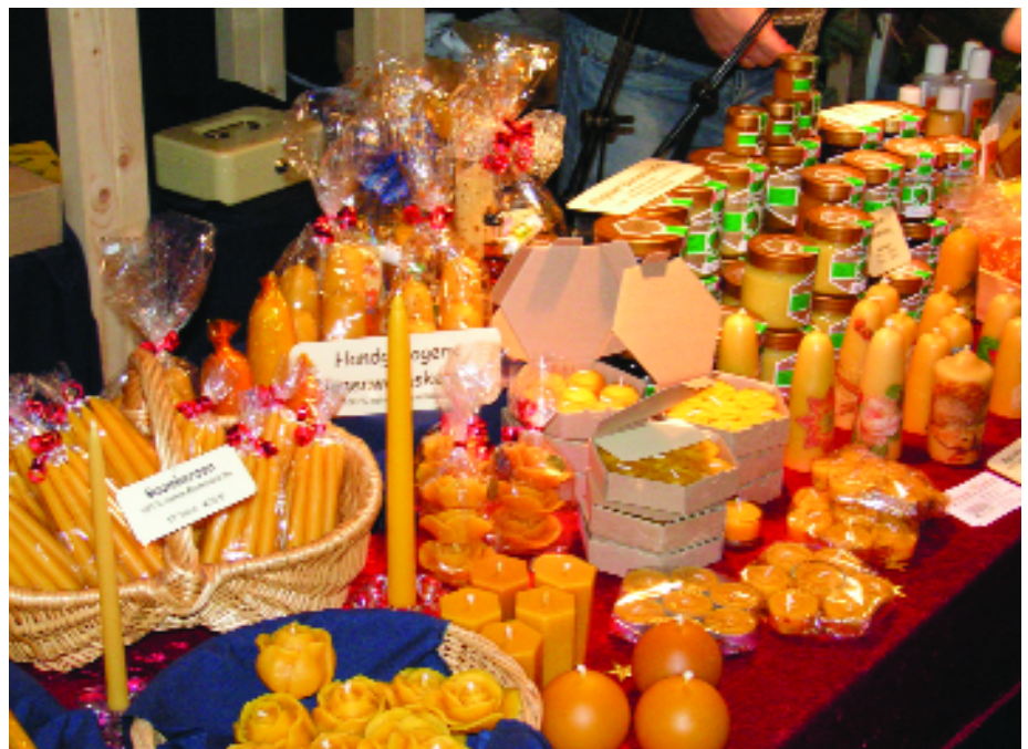
Weihnachtsmärkte sind oft leichter zu beschicken als ganzjährige Wochenmärkte.

Solche Beispiele lassen sich noch beliebig fortsetzen. Hier ist eigene Kreativität gefordert, um frühzeitig neue Chancen und Wege zu erkennen.