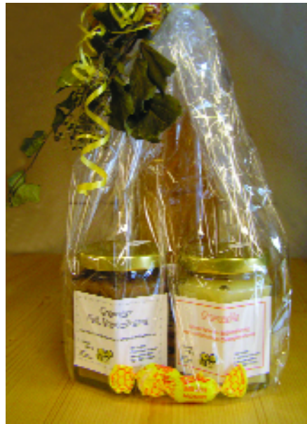
Werbegeschenke mit Imkereiprodukten sind eine Möglichkeit für neue Absatzwege.

Eine wachsende Zahl an Lebensmittelskandalen bewirkte einen Wertewandel bei den Verbrauchern. Der Wunsch nach mehr Natürlichkeit und gesicherter Herkunft der Produkte ergibt für uns eine gute Chance für die Vermarktung heimischer Imkereiprodukte. Nachdem die Kunden durch die verschiedenen Lebensmittelskandale immer kritischer und selbstbewusster geworden sind, stellen sie hohe