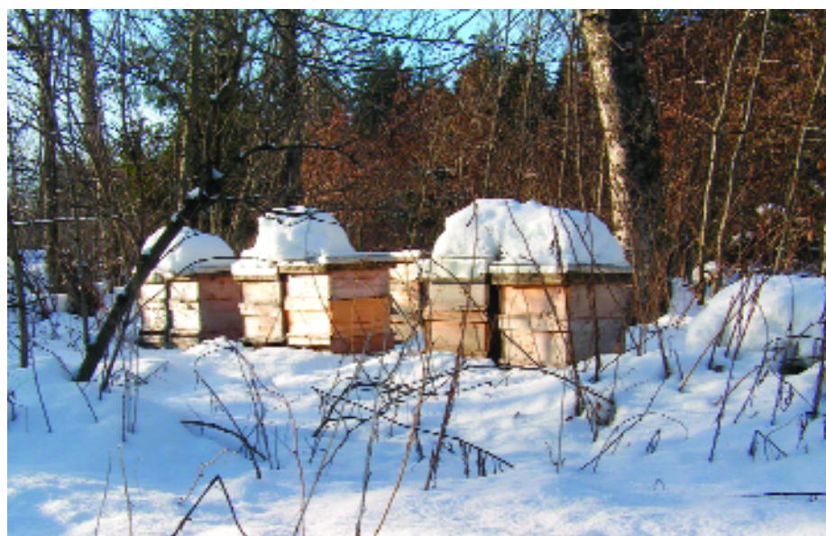
▲ Die Bienen und die Imker haben im Winter etwas Ruhe.

Am Ende des Jahres wird Resümee gezogen. Das abgelaufene Jahr lässt man Revue passieren. Die dabei getätigten Aufzeichnungen machen manche Beobachtung leichter erklärbar. Bei einem Jahresrückblick sollten jedoch nicht die Versäumnisse oder Fehler im Mittelpunkt stehen, sondern auch die Freude an besonderen Erlebnissen oder Vorkommnissen auskosten werden.